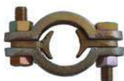
Bride de serrage pour raccord cannelé