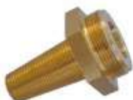
Raccord cannelé pour plomb